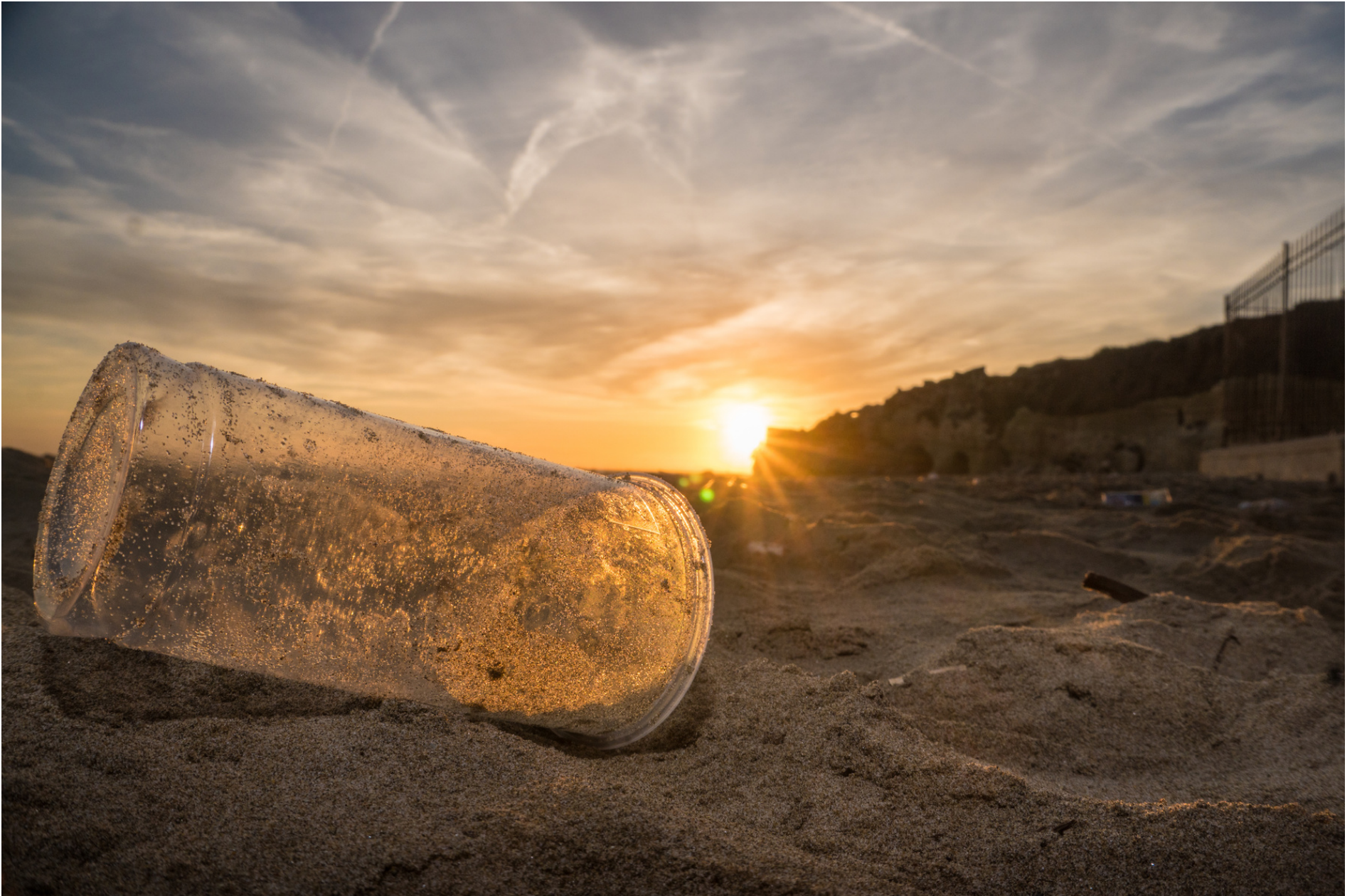
Sunset in a plastic container // Tramonto in contenitore di plastica