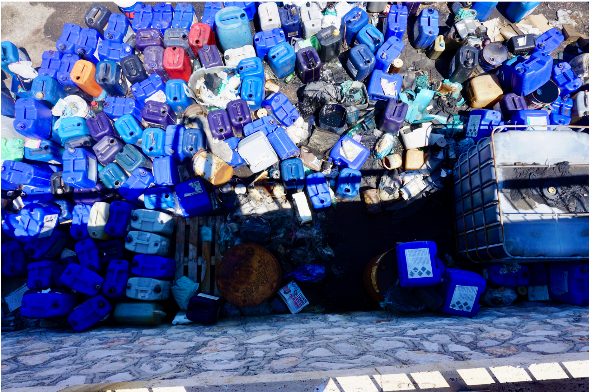
A blue sea of used oil tank at the fishermen's harbour // Un mare blu di taniche di olii usati al porto dei pescatori