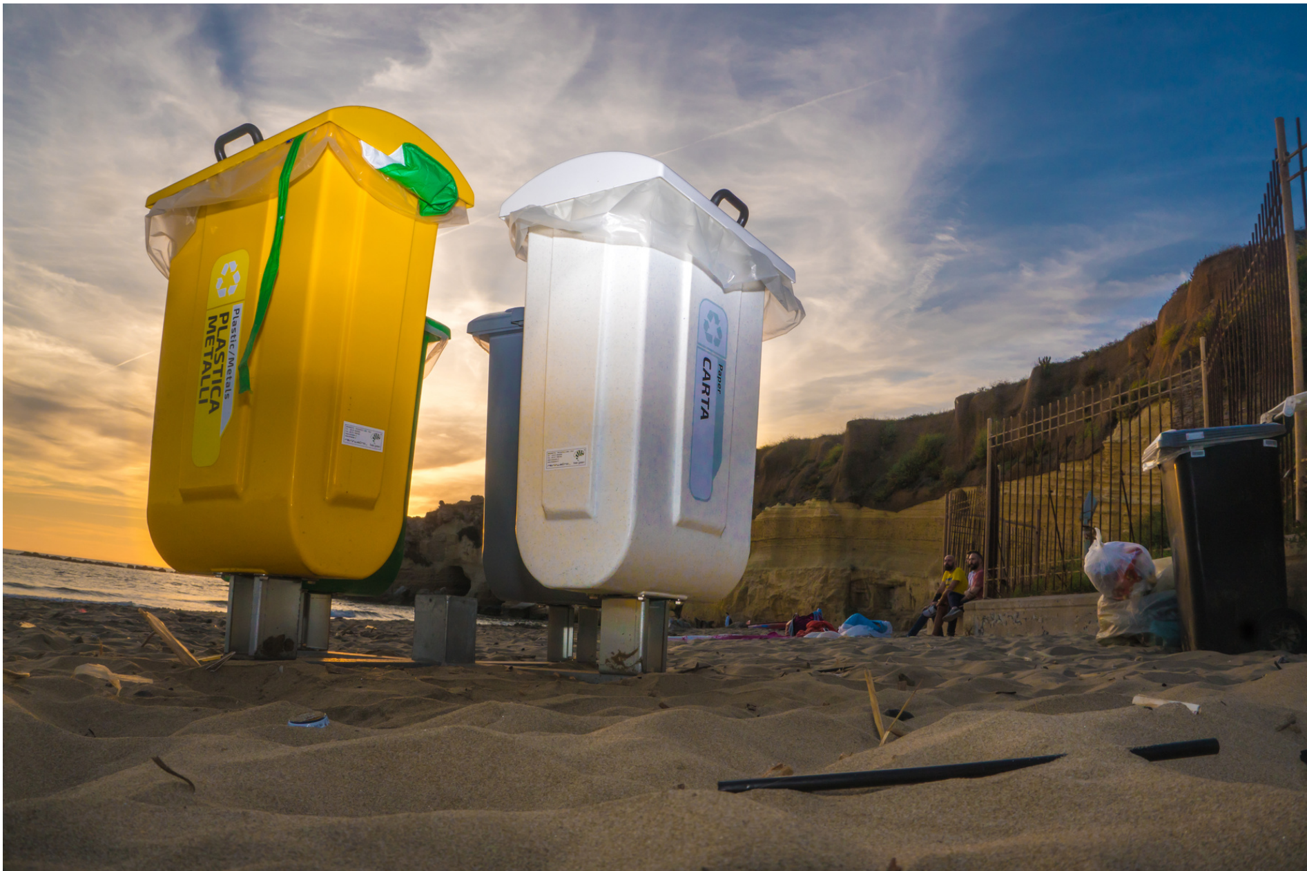
Empty bins, dirty sand // Secchioni vuoti, spiaggia sporca