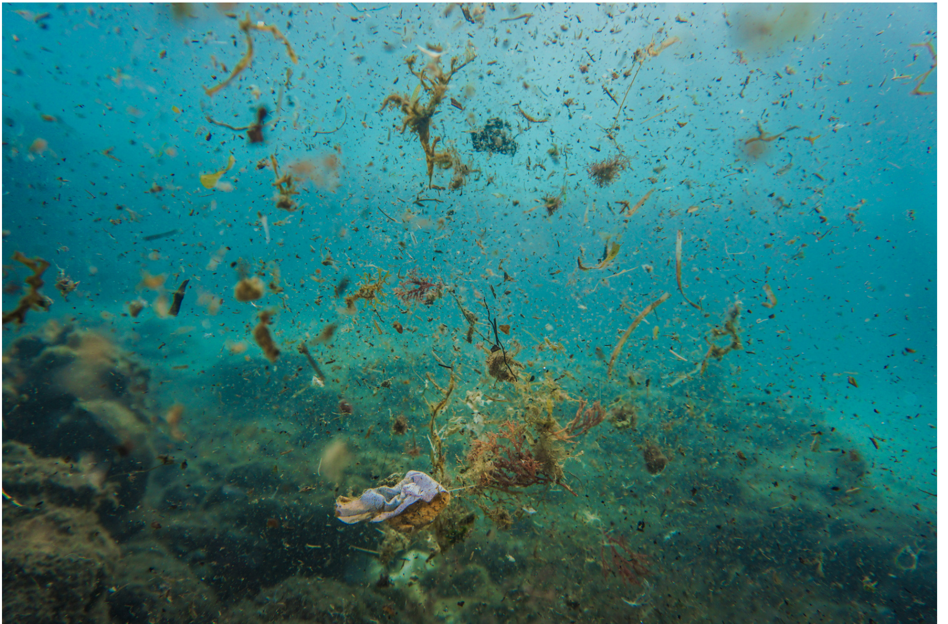
Female absorbents and algal formations // Assorbenti femminili e formazioni algali