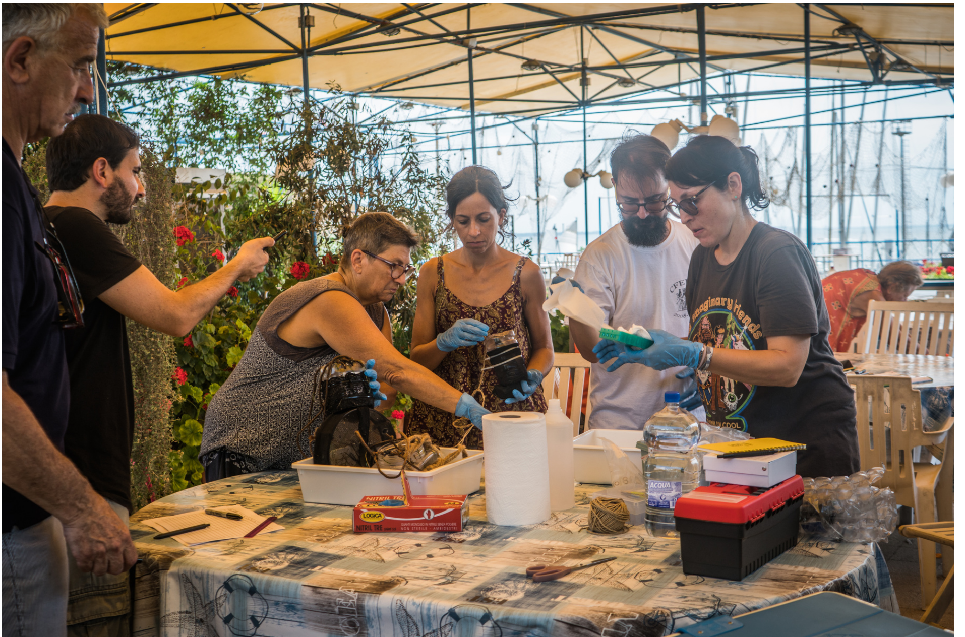
Preparation of microplastic samples // Preparazione dei campioni di microplastiche