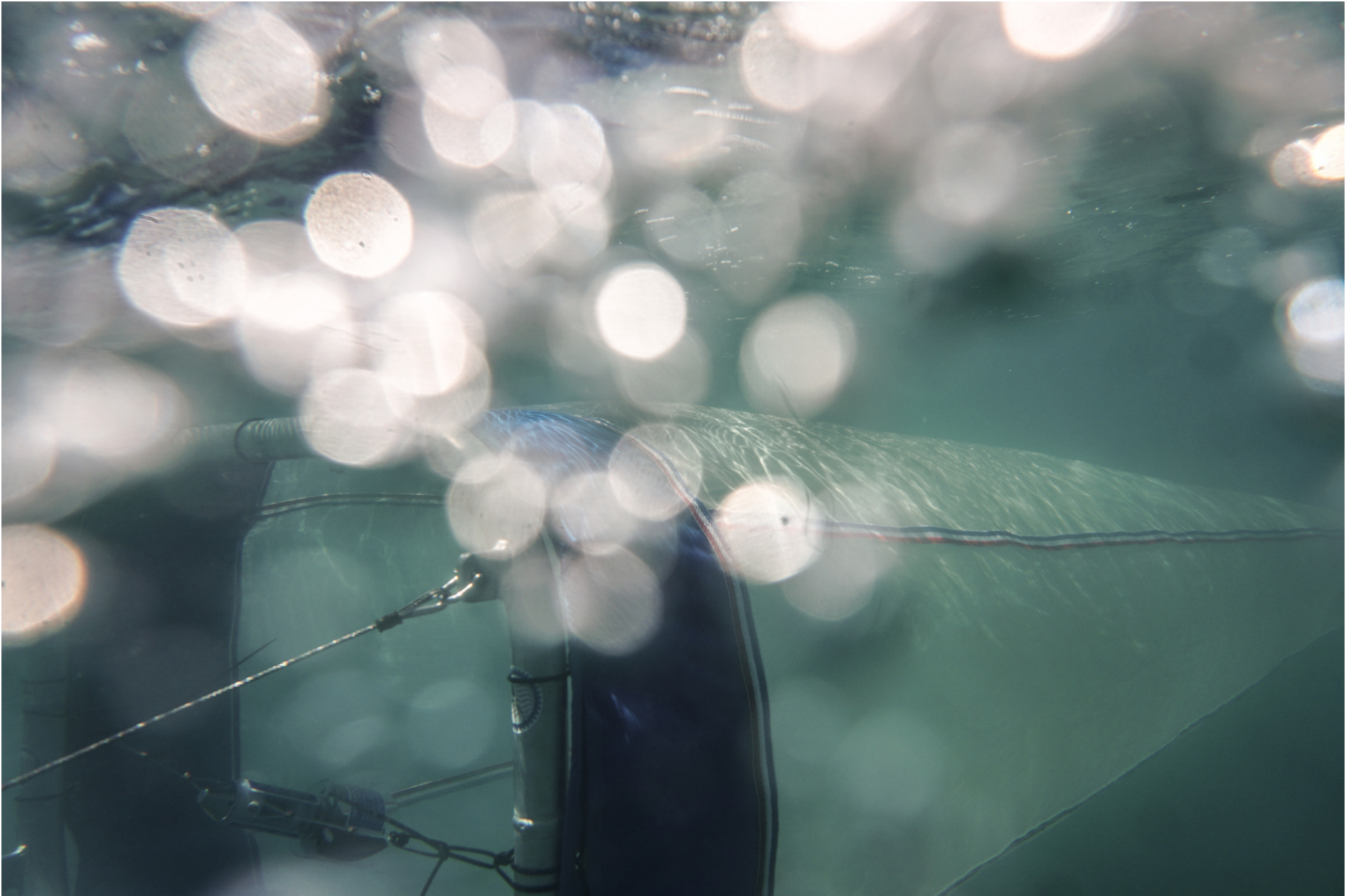
Neuston-net in action // Neuston-net in azione