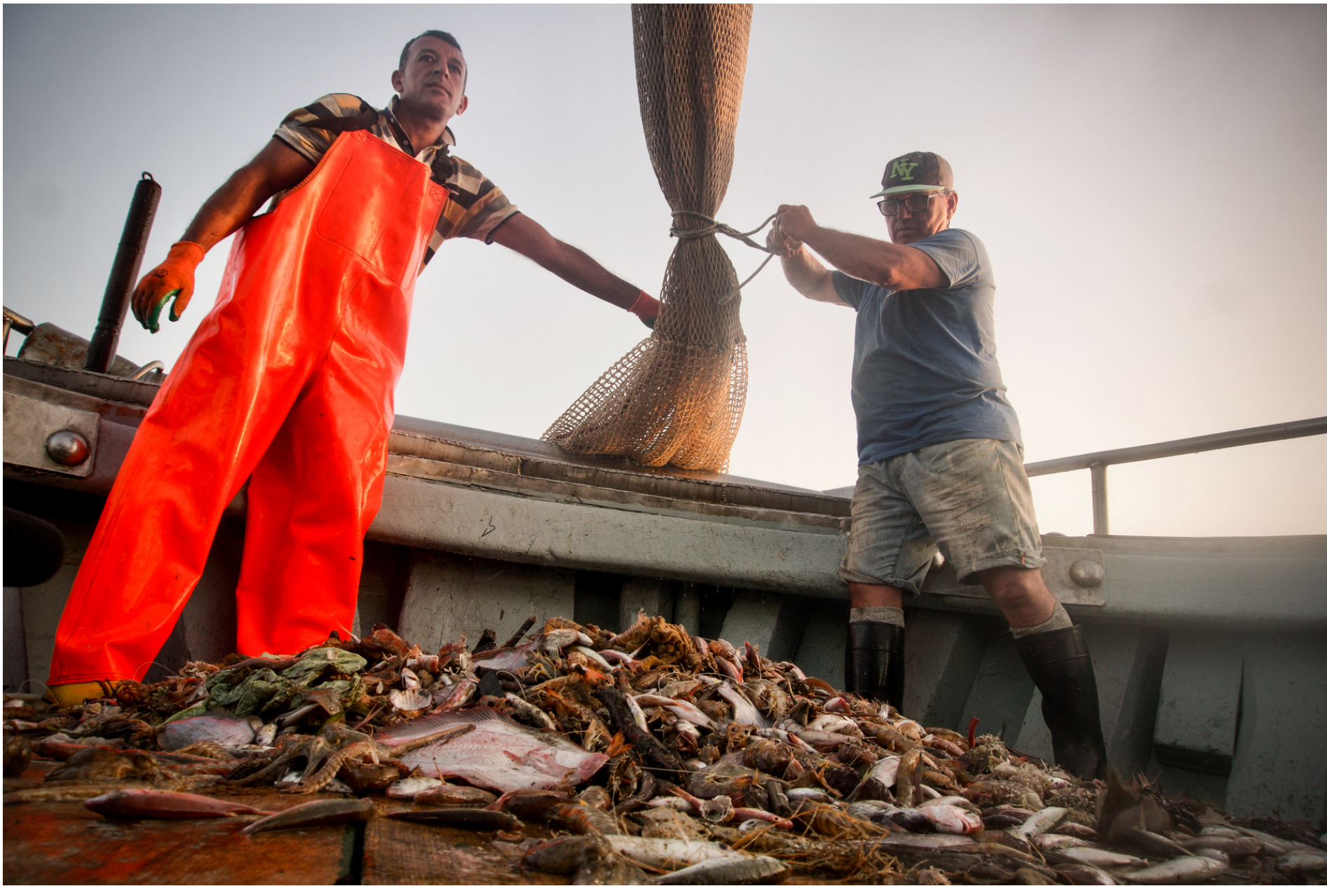
Fishing plastics // Pescando plastica