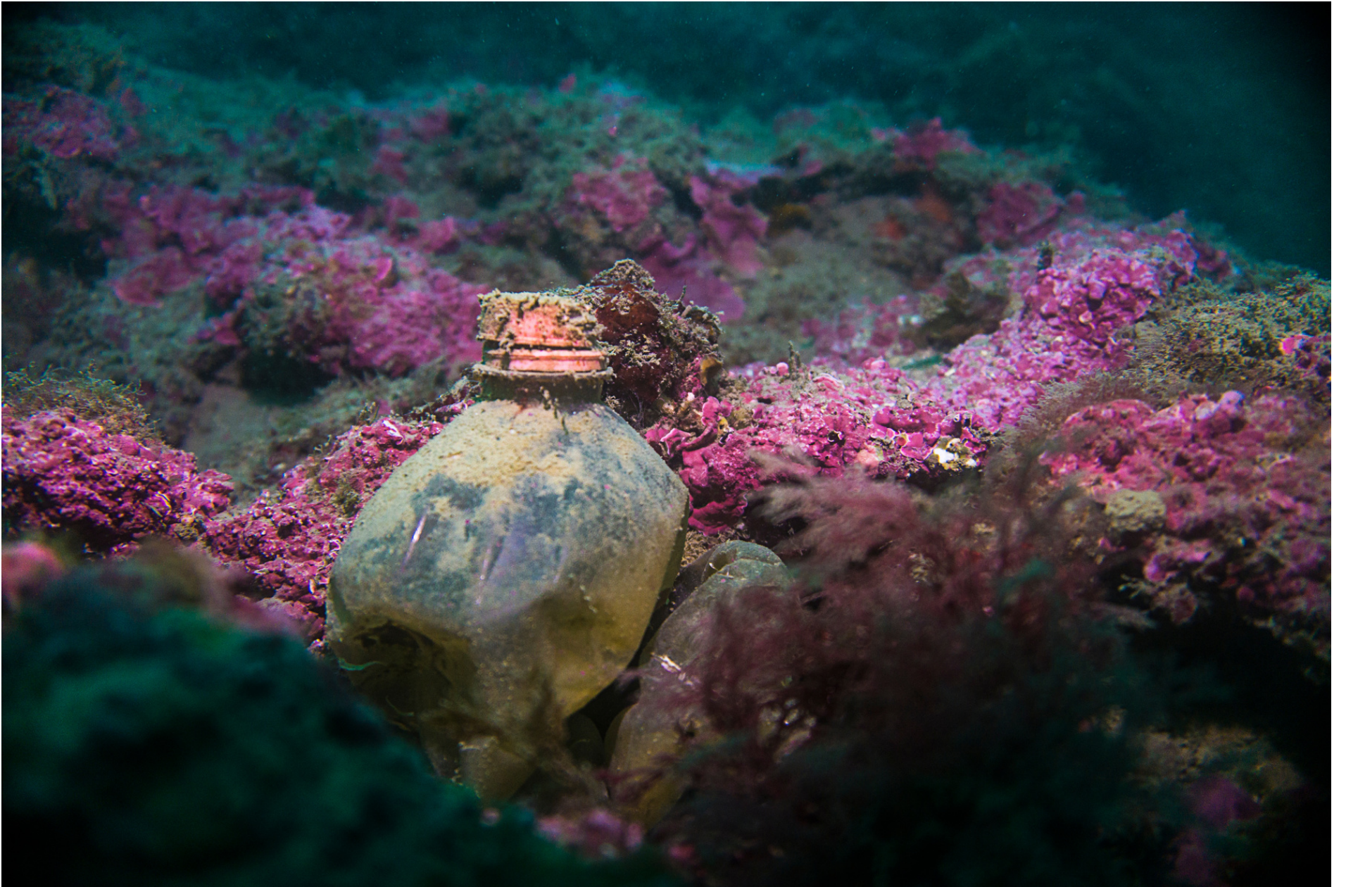
“Spring water”. Plastic bottle, rocks and coralligenous // “Acqua sorgiva”. Bottiglia di plastica, rocce e coralligeno