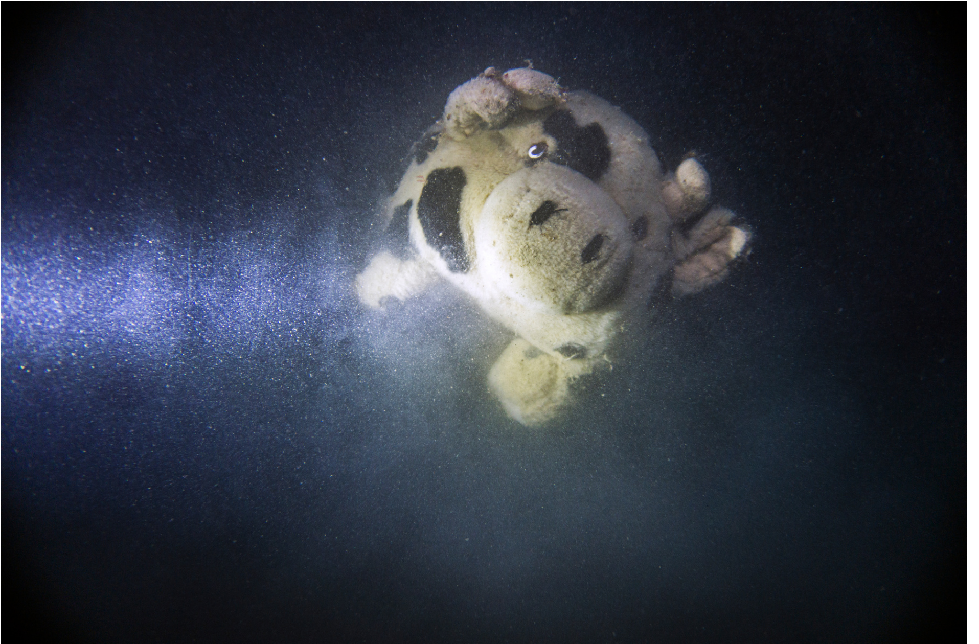
Underwater cow // Mucca sottomarina