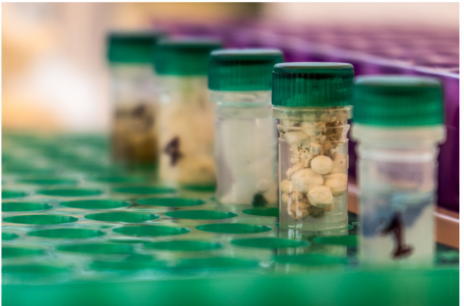
Microplastics ready for the lab//Microplastiche pronte per il laboratorio