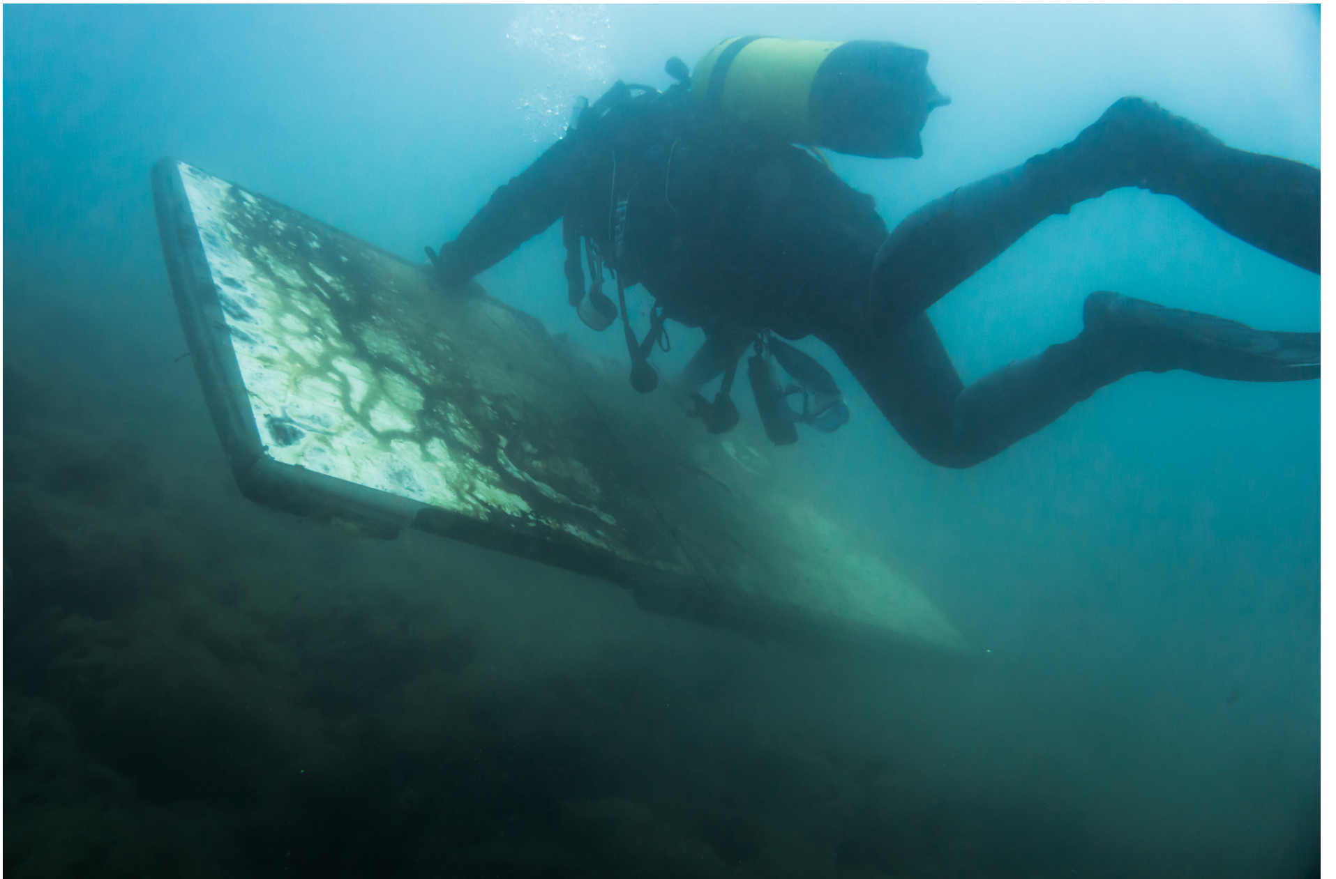
A scuba divers collecting a plastic table covered by algae and crustaceans // Un sub raccoglie un tavolo di plastica coperto di alga e crostacei