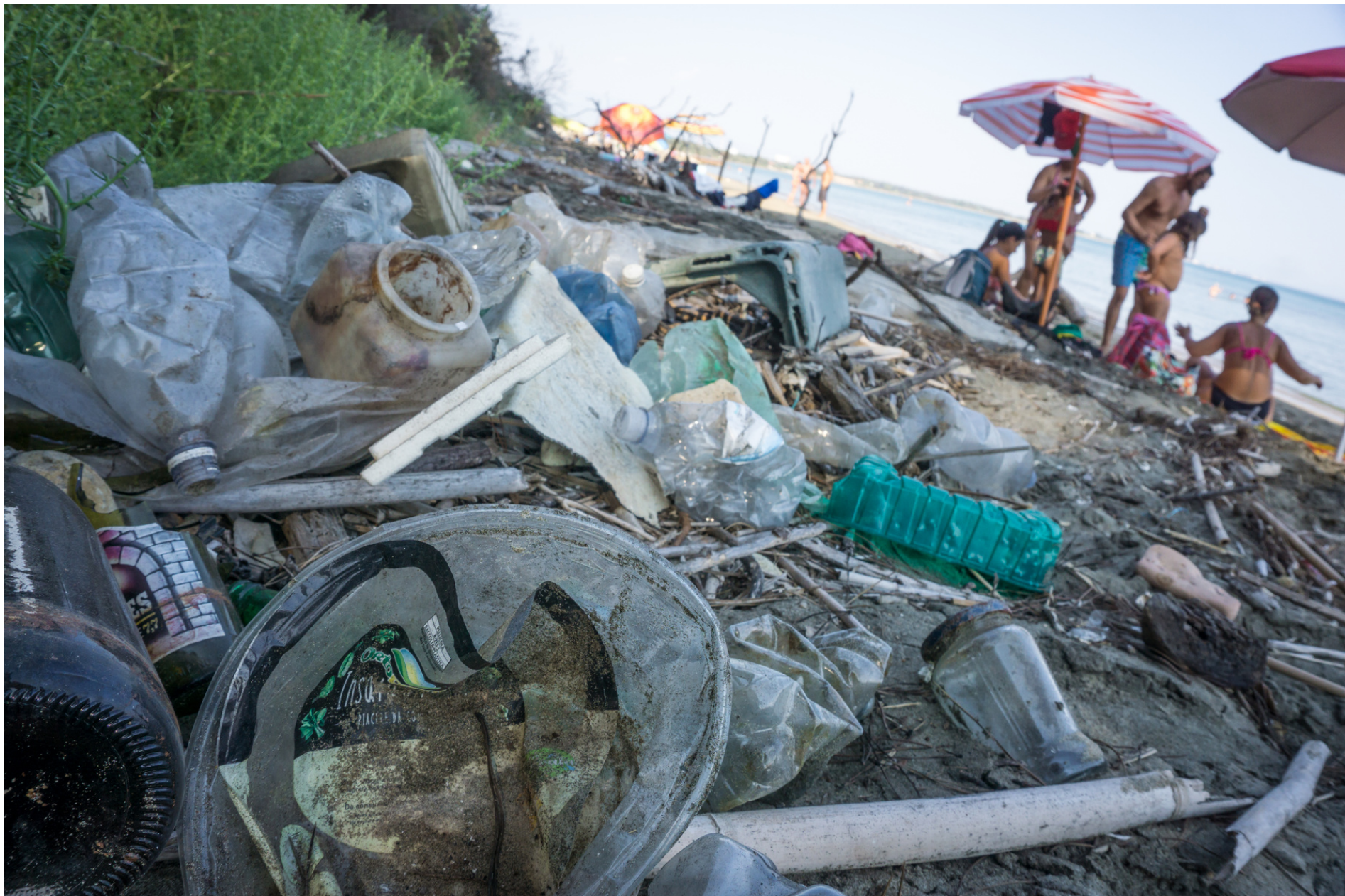
Wastes on the beach // Rifiuti sulla spiaggia