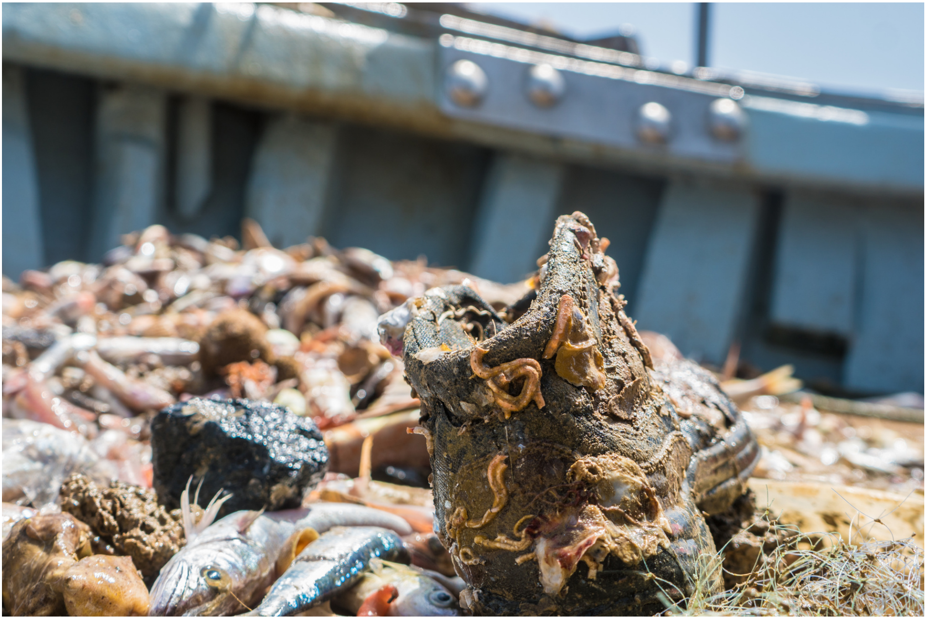
Tube worm on a shoe // Gallerie di vermi di mare su scarpa