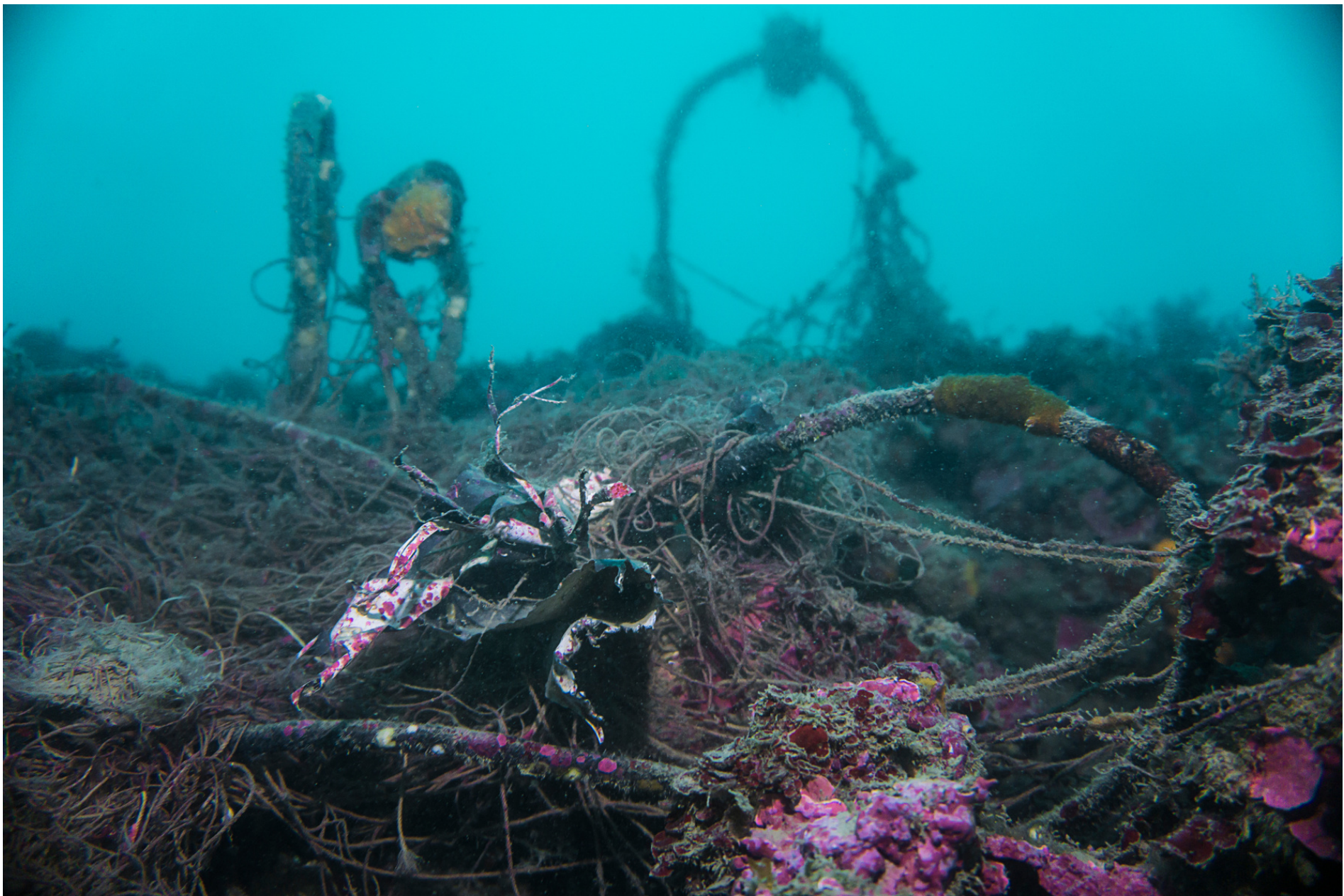
Underwater floral motives of cables and floatings// Cavi e galleggianti in motivi floreali