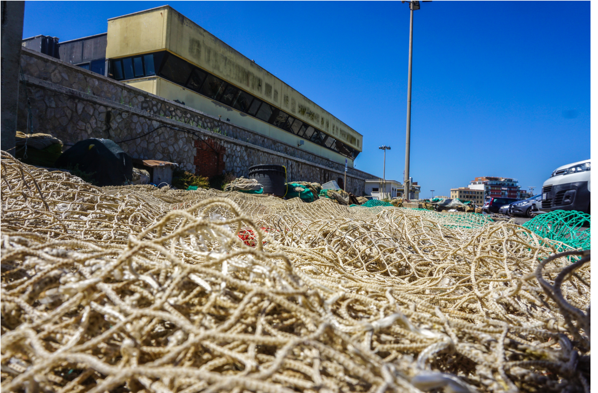
Abandoned fishing net at the fishermen's harbour // Reti da pesca abbandonate al porto dei pescatori