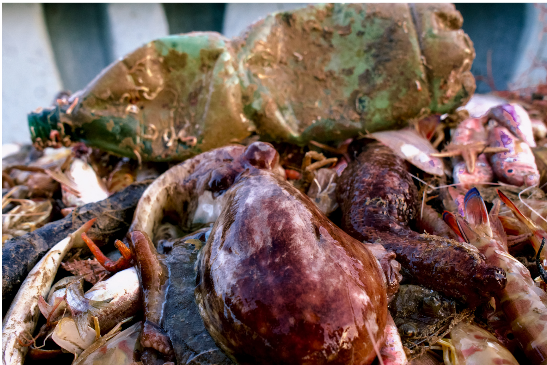
Catch of the day //Pescato del giorno