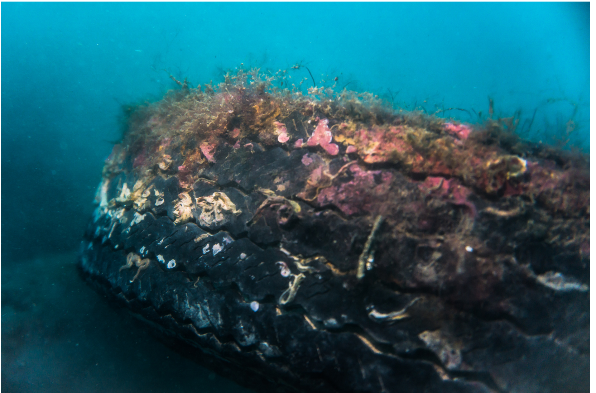
Algal formation on tire // Formazioni algali su gomma