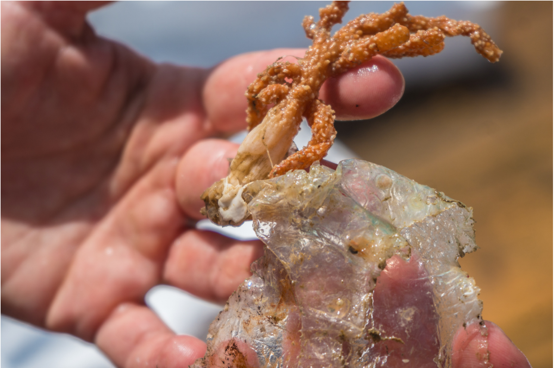
Gorgonian on plastic // Gorgonia su plastica