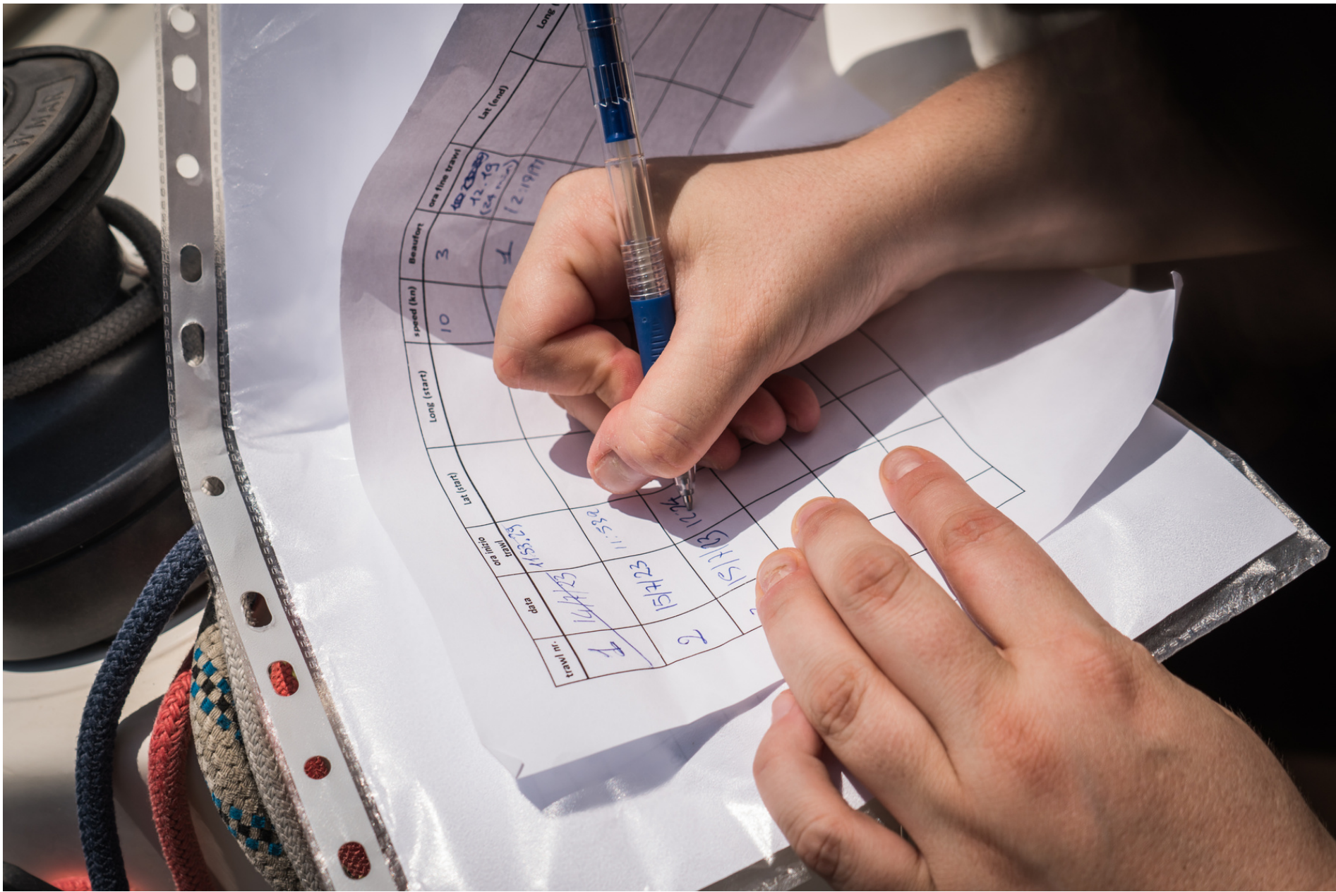
Taking notes of sampling position // Prendere nota della posizione di campionamento