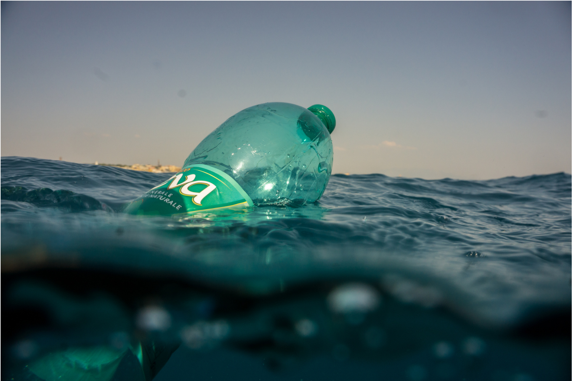
Floating bottle // Bottiglia galleggiante