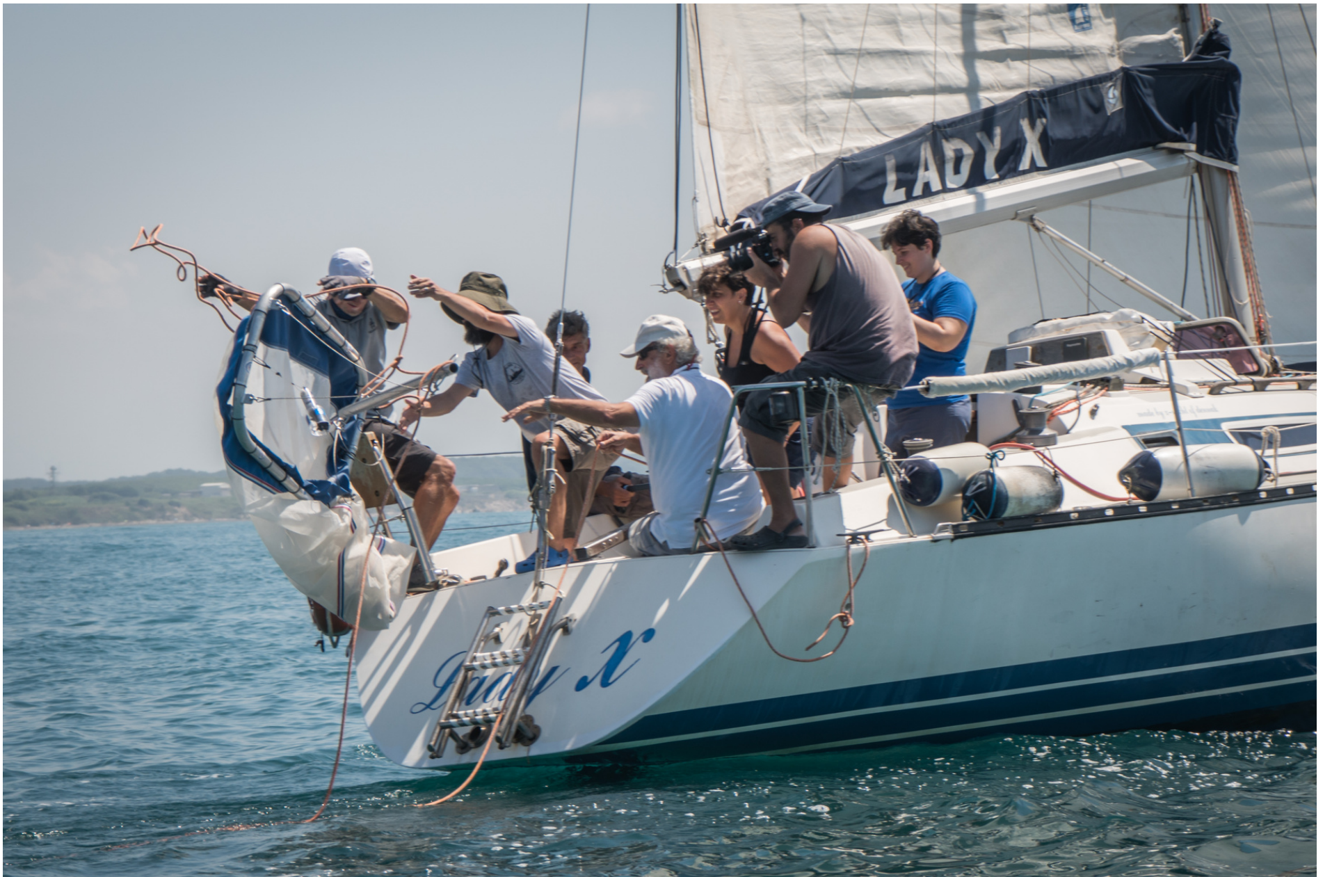
Monitoring microplastic on sailing boat // Monitoraggio delle microplastiche in barca a vela